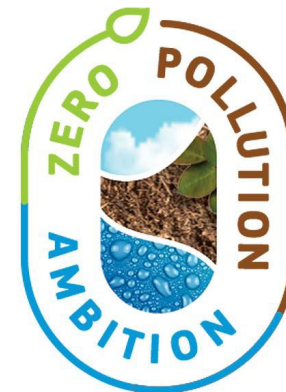
Zero pollution action plan (europa.eu)