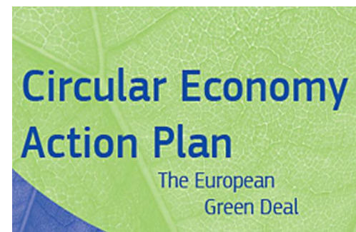
Circular economy action plan (europa.eu)