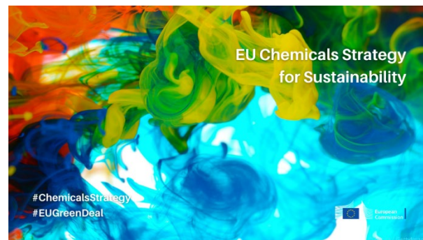
Chemicals strategy (europa.eu)