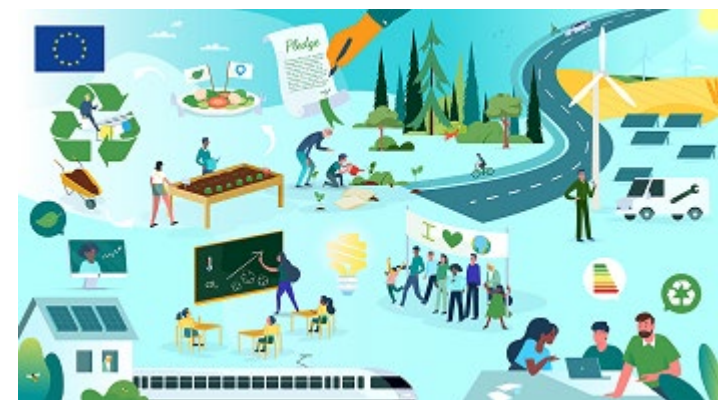
Climate action and the Green Deal | European Commission (europa.eu)